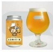
OUR BREWING クラフトビール