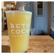
BETO COCO BREWING クラフトビール

クラフトビールやおつまみ、ごはんにスイーツ！ お花見にピッタリの美味しいグルメと縁日が大集結するよ！