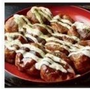
OCTOBER OCTOPUS たこ焼き