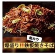
ヤナギ商会 鉄板焼き