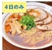
Jack&Beans (豆の木) ラーメン