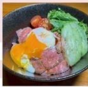
Berry ローストビーフ丼