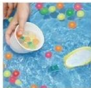
福井県立大学 創造農学科2年生 スーパーボール掏いと ヨーヨーつり