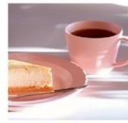
café&cake tuzu awara スペシャルティコーヒー