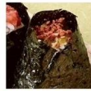
ほかほかおむすび ベコベコ いちほまれおむすび