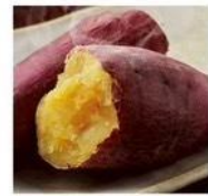
カメハメハ大農場の 農家カフェ 焼き芋