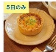
by your side キッシュ・焼き菓子