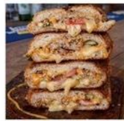
RESORT STYLE Siam キューバサンド