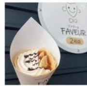
FAVEUR 2号店 クレープ