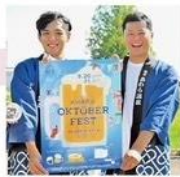
旅館組合青年部 ビール/ソフトドリンク