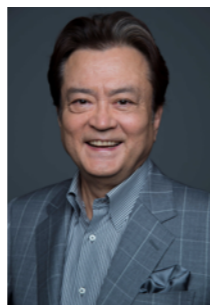
敦賀観光特任大使 大和田伸也