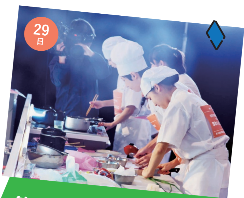
第18回 全国高校生食育王 選手権大会 決勝大会