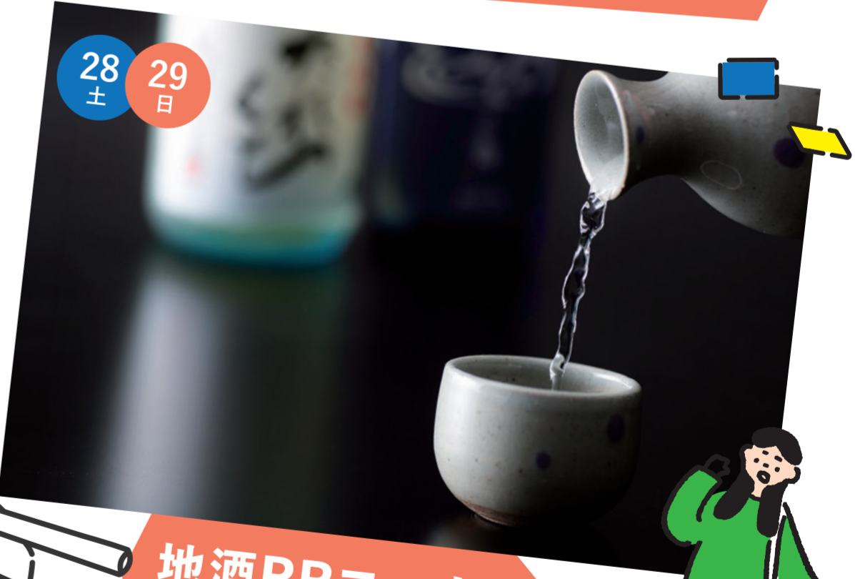
地酒PRコーナー (さかほまれ地酒)