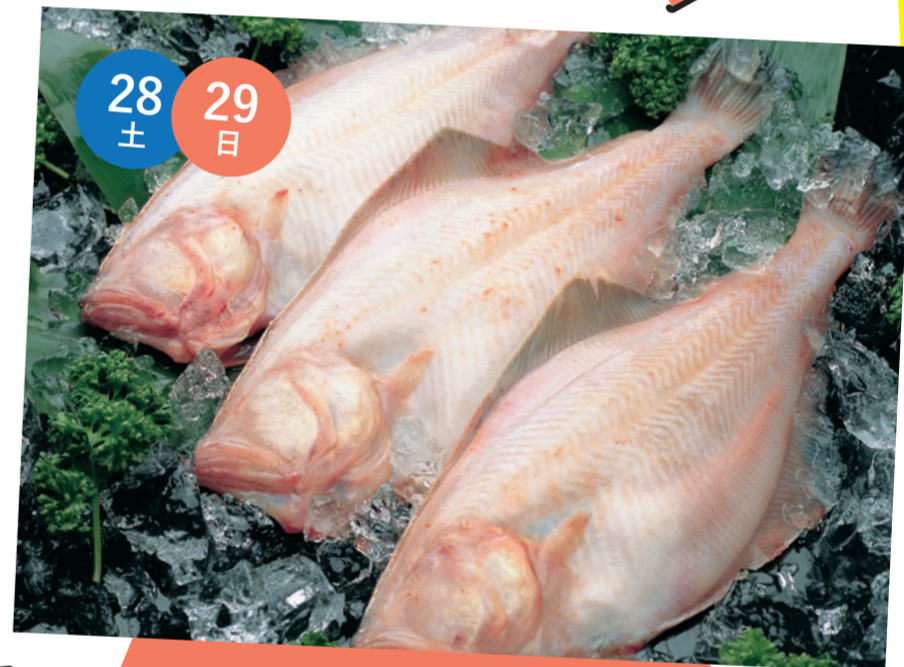
ふくいブランド食材 PRコーナー