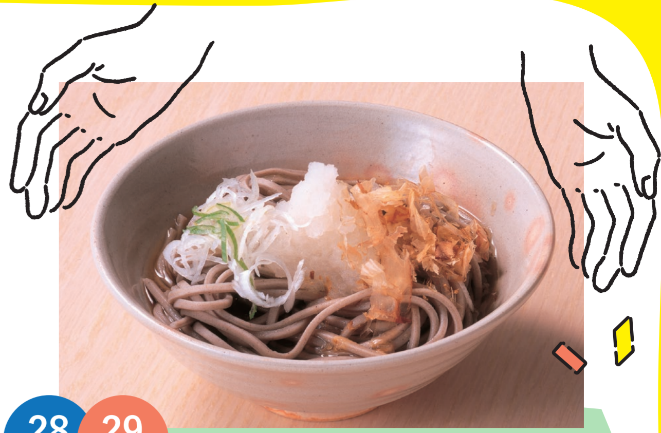
28 土 29 日