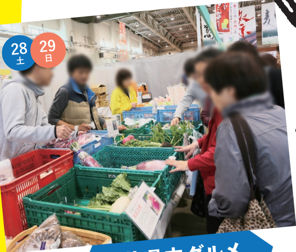
福井県内グルメ 味わいコーナー