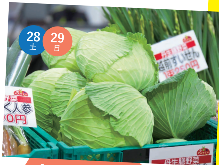
食と農のPR・ 販売コーナー