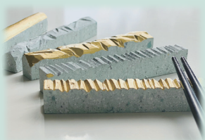
笏谷石でできた箸置きイメージ いくつかの種類の中から 1点プレゼント