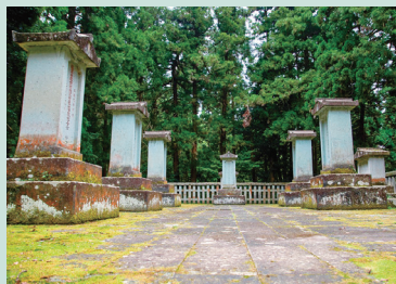
大安禅寺 千畳敷イメージ

但し、お一人参加・バス座席2席利用をご希望される場合2,000円追加料金として申し受けます