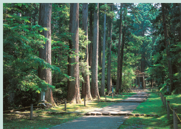
平泉寺白山神社イメージ

但し、お一人参加・バス座席2席利用をご希望される場合2,000円追加料金として申し受けます