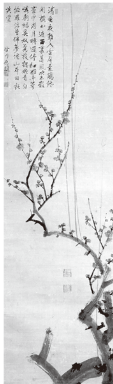
紙本墨画 墨梅図 維明周奎筆（高浜町郷土資料館蔵）