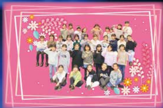
チョコマッシュ&フラワーズ