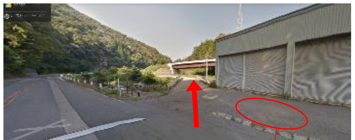
集合場所 写真のシャッター前あたり