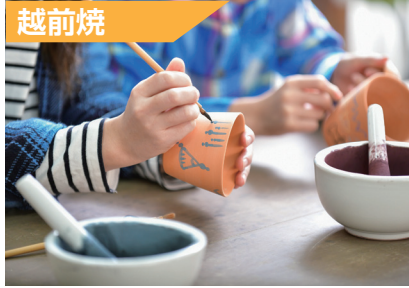
絵付け体験(作品は、後日発送)