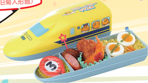
©2021 SANRIO CO., LTD. APPROVAL NO. L624180 ドクターイエロー× ぐでたま弁当 税込 1,300円