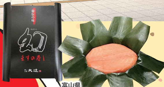
富山県 幻のますの寿司 税込 2,300円