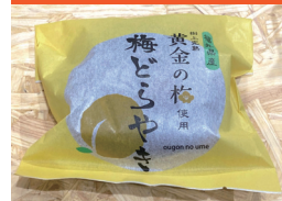
黄金の梅どらやき