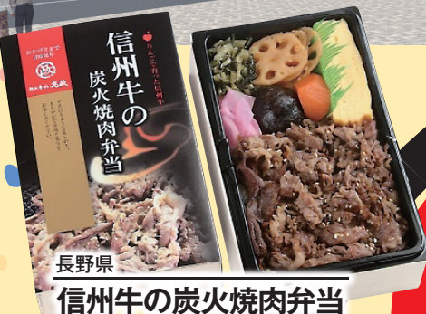
長野県 信州牛の炭火焼肉弁当 税込 1,900円