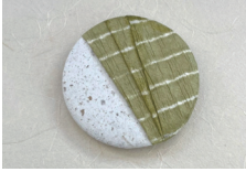
和紙缶バッチづくり体験