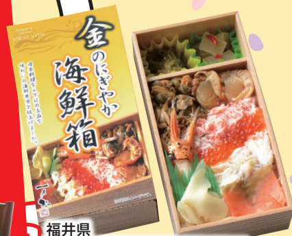
福井県 金のにぎやか海鮮箱 税込 1,300円

3/26(土)27(日) 10:00~16:00 会場 武生中央公園 屋内催事場(旧菊人形館)