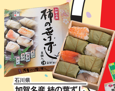
石川県 加賀名産 柿の葉ずし 税込 1,000円