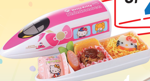
©2021 SANRIO CO., LTD. APPROVAL NO. L624180 500系ハローキティ 新幹線弁当 税込 1,300円