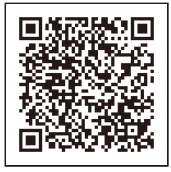
参加店舗はコチラ

いちご大福大集合!市内5店舗のいちご大福を大特価にて限定販売いたします。 ※商品は無くなり次第、販売を終了します。