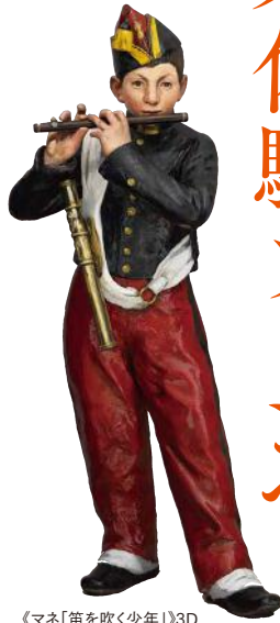
《マネ「笛を吹く少年」》3D