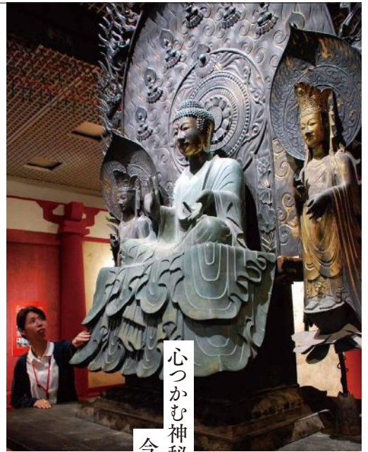
《法隆寺 釈迦三尊像》再現