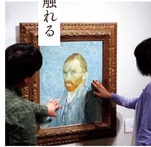
《フィンセント・ファン・ゴッホ「自画像」》再現