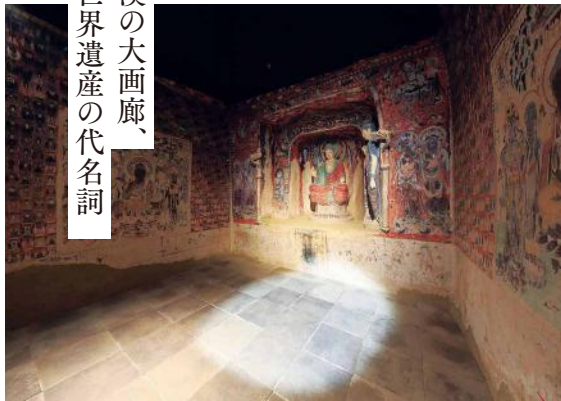
《敦煌莫高窟第57窟》再現