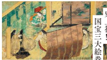
《源氏物語絵巻 第五十帖 東屋一 絵》現状模写